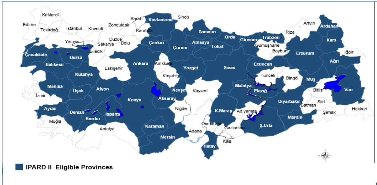
Şekil 1. Programın Başlaması ile Birlikte IPARD 2014-2020'den Yararlanacak Olan İller

2007-2013 programından sorunsuz bir geçiş sağlamak amacıyla 2014-2020 programı ilk başta IBBS Düzey 3 bölgelerine karşılık gelen ve IPARD 2007-2013'ün uygulandığı 42 ili (Afyonkarahisar, Ağrı, Aksaray, Amasya, Ankara, Ardahan, Aydın, Balıkesir, Burdur, Bursa, Çanakkale, Çankırı, Çorum, Denizli, Diyarbakır, Elazığ, Erzincan, Erzurum, Giresun, Hatay, Isparta, Kahramanmaraş, Karaman, Kars, Kastamonu, Konya, Kütahya, Malatya, Manisa, Mardin, Mersin, Muş, Nevşehir, Ordu, Samsun, Sivas, Şanlıurfa, Tokat, Trabzon, Uşak, Van ve Yozgat ) kapsayacaktır. Ulusal Kırsal Kalkınma Stratejisi, IPARD Programı'nın 81 ilin tamamının katılımını öngördüğünden, eldeki bütçe, fon emilim eğilimleri ve maliyet/kâr analizi ile yönetim maliyetleri göz önünde bulundurularak IPARD 2014-2020 program kapsamının tüm illere genişletilmesi gündeme gelebilir. Karar alınırken ayrıca, AB Kırsal Kalkınma deneyiminin tüm ülke genelinde genişletilmesi ile ortaya çıkan katma değer de hesaba katılacaktır.