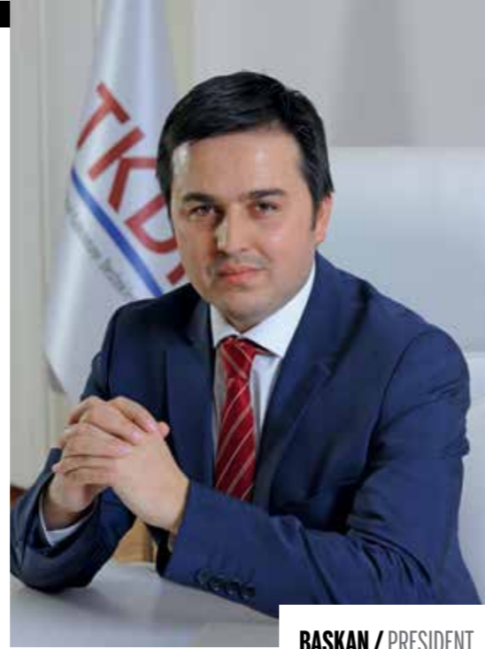
BAŞKAN / PRESIDENT